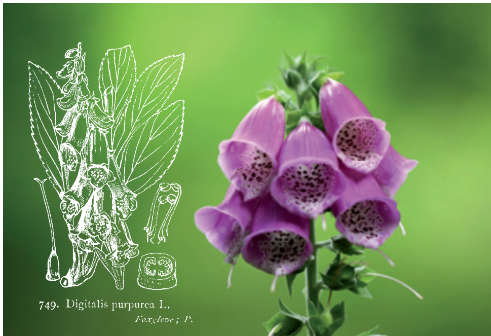
749. Digitalis purpurea L. Foxglove ; P.

tak, aby poslúžila a neškodila. V tom je bylinná liečba v rámci TČM naozaj výnimočná. Je presne dané, čo môže zvýšiť alebo ovplyvniť toxicitu liečiva. Týchto faktorov je niekoľko, spomeniem len najdôležitejšie.